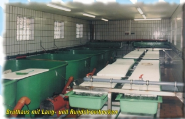
Brüthaus mit Lang- und Rundsteinbecken

Gefüttert wird nach alter Fischzüchterart ausschließlich von Hand.