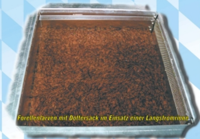
Forellentlarven mit Dottersack im Einsatz einer Langstromrinne.